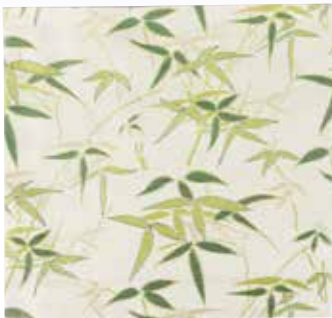
324-083 古帛紗「竹葉紋」 3,080円(税込)紙箱