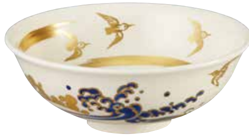
324-071 波に千鳥絵平茶碗 今岡 都作 特別価格 8,250円(税込)紙箱 [寸法]口径14.5cm 高さ5.7cm(京焼)