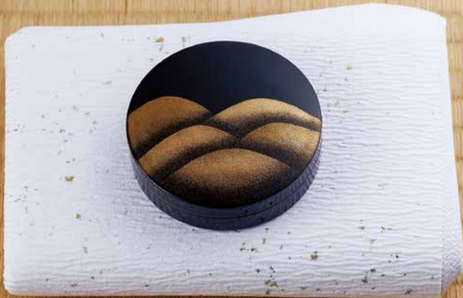
324-041 遠山蒔絵香合 一瓢斎作 198,000円(税込)木箱 〔寸法〕径7.5cm 高さ2.2cm