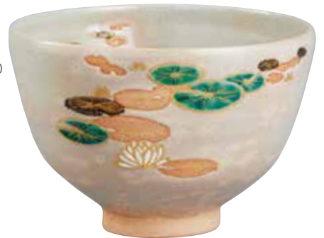
324-037 蓮絵茶碗 巖窯 11,880円 (税込)木箱 [寸法]口径12cm 高さ8.2cm(京焼)