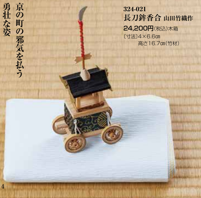
324-021 長刀鉾香合 山田竹織作 24,200円 (税込)木箱 [寸法] 4×6.6cm 高さ16.7cm(竹材)