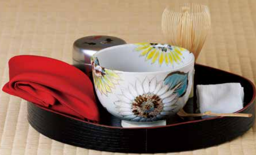
324-034 ひまわり絵茶碗 山川敦司作 30,800円 (税込)木箱 [寸法]口径11.8cm 高さ8.1cm(京焼)