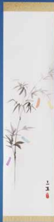
324-016 絵掛物「七夕」三生画 12,870円 (税込)紙箱 [寸法] 巾25cm 長さ123cm