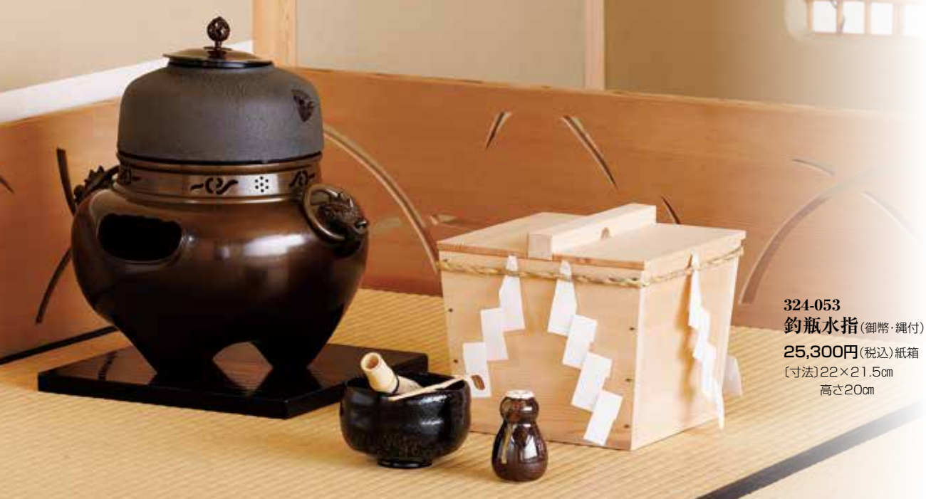
324-053 釣瓶水指 (御幣・縄付) 25,300円 (税込) 紙箱 (寸法) 22×21.5cm 高さ20cm