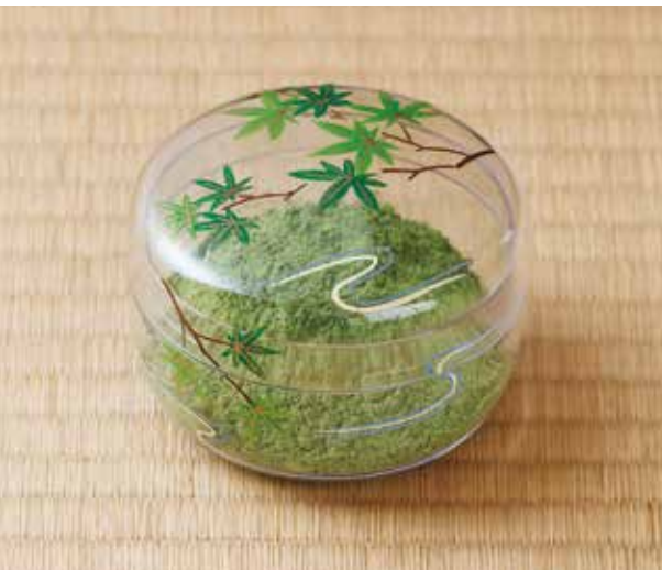
324-004 青楓に流水絵透明平棗 5,390円 (税込)紙箱 (寸法)胴径8.7cm 高さ6cm(樹脂製)