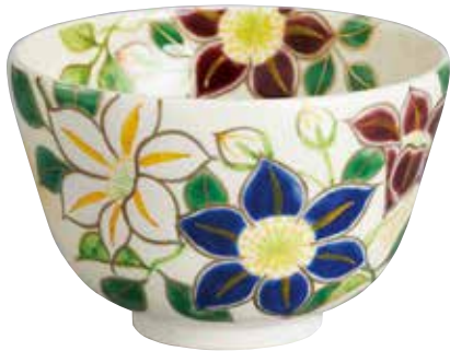
324-072 鉄仙絵茶碗 水出宋絢作 7,480円(税込)紙箱 [寸法]口径13.2cm 高さ9cm(京焼)