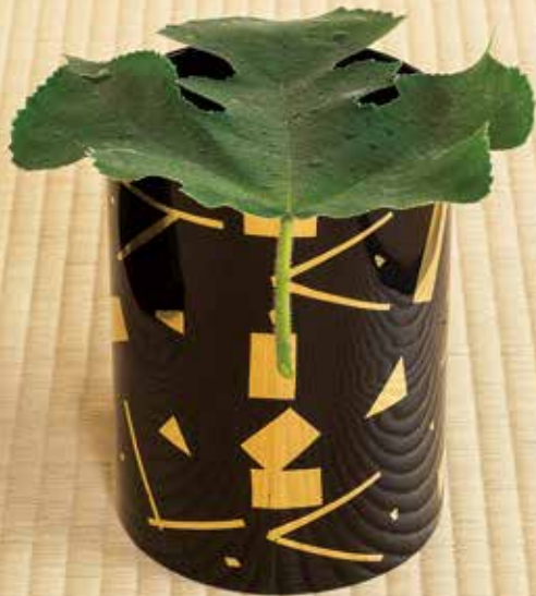
324-076 玄々斎好写 末広籠受筒 優工房製 特別価格 22,000円(税込)紙箱 [寸法] 胴径13.7cm 高さ18.4cm(木製漆)