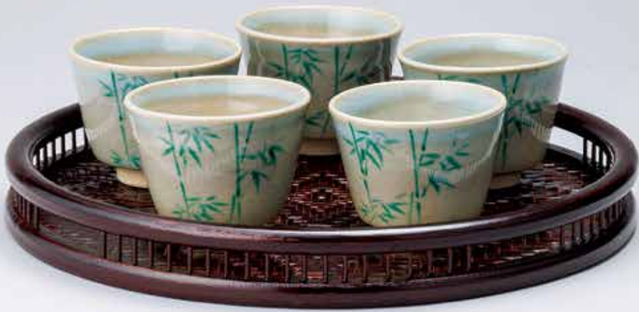
324-081 網代編み 透かし丸盆 8,800円(税込)紙箱 〔寸法〕径29.7cm 高さ3.5cm