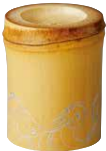
324-085 竹蓋置「波」(風炉用) 特別価格 2,750円(税込)紙箱