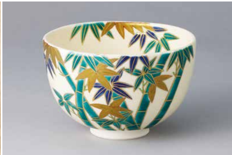
324-003 色絵 竹林絵茶碗 中村華峰作 13,200円 (税込)木箱 (寸法)口径12.2cm 高さ8cm(京焼)