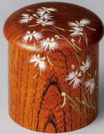
324-069 鷺草絵金輪寺 中林貴山作 20,900円(税込)木箱 [寸法]胴径6.1cm 高さ6.8cm(榿材)