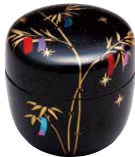
324-017 七夕絵中棗 特別価格 3,520円 (税込)紙箱 [寸法] 胴径6.8cm 高さ6.8cm (樹脂製)