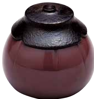
324-038 茄子茶器 岩倉栄一作 17,160円 (税込)木箱 [寸法]胴径7cm 高さ6.5cm(山中塗・木製漆)