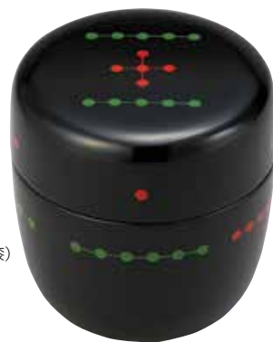
13,200円(税込)木箱 [寸法] 胴径6.7cm 高さ7.1cm(山中塗・木製漆)