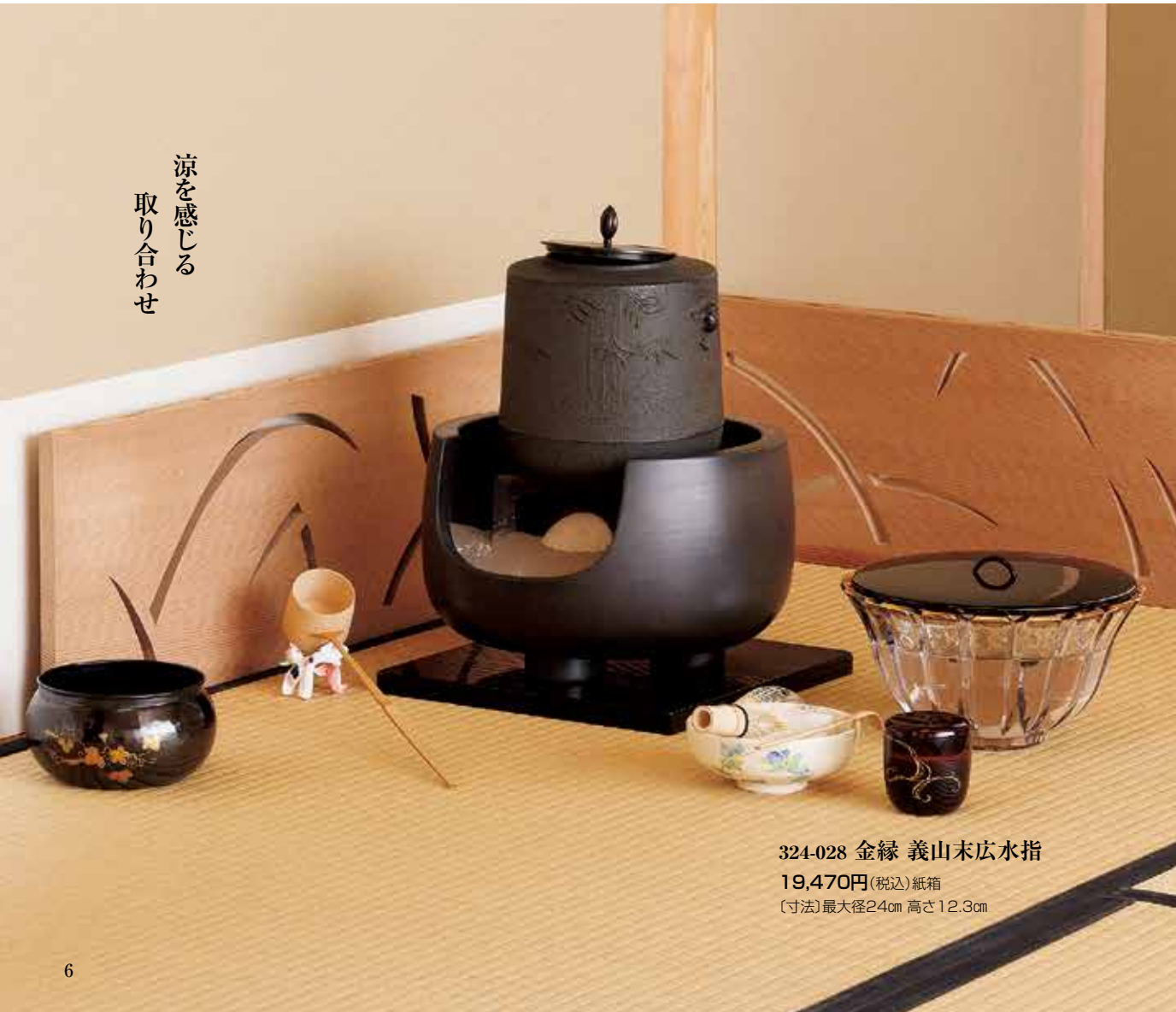
324-028 金縁 義山末広水指 19,470円(税込)紙箱 〔寸法〕最大径24cm 高さ12.3cm