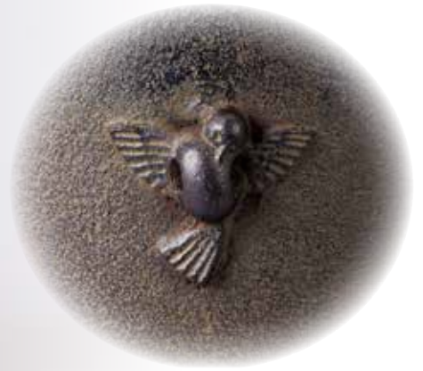
324-027 竹地紋 雀鉤付筒釜(風炉用) 菊地政光作 特別価格 72,600円(税込)木箱 〔寸法〕胴径18.6cm 高さ18.6cm(蓋含まず)