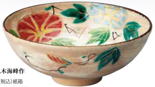
324-082 朝顔絵平茶碗 八木海峰作 特別価格 4,950円(税込)紙箱 〔寸法〕口径14.3cm 高さ5.6cm(京焼)