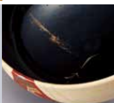
324-019 祇園祭 長刀鉾絵平茶碗 今岡三四郎作 33,000円 (税込)木箱 [寸法] 口径13.5cm 高さ5.8cm(京焼) 天高く伸びる長刀が内側まで続いています。