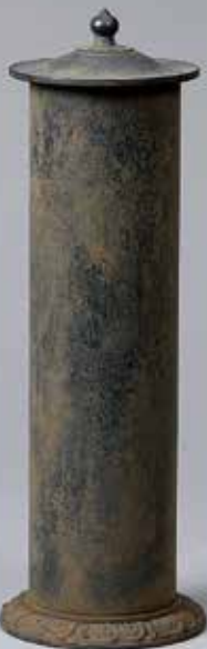
324-039 唐銅 経筒花入 金谷浄雲作 34,650円 (税込) 木箱 [寸法]胴径6.5cm 高さ23.7cm