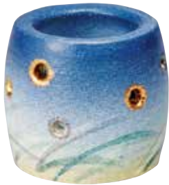
324-002 楽焼 蛭蓋置 楽入窯 8,360円 (税込)紙箱 (寸法)胴径5.8cm 高さ5.6cm(京焼)