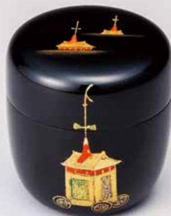
324-020 祇園祭 鉾蒔絵中棗 中林貴山作 18,260円 (税込)木箱 [寸法] 胴径6.6cm 高さ7cm(山中塗・木製漆)