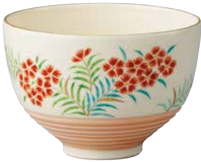
324-070 撫子絵茶碗 山川嘉山作 6,380円(税込)紙箱 [寸法]口径12cm 高さ8.3cm(京焼)